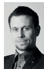
Autor: Georg Grundei, diplômé Wirtschaftsbereichs- sekretär Gewerkschaft der Privatangestellten, Druck, Journalismus, Papier (GPA-djp)

Es ist also höchste Zeit, diesen Berufstätigen auch beim Einkommen die entsprechende Wertschätzung entgegenzubringen. Der überwiegende Teil wünscht sich eine einmalig erhöhte Gefahrenzulage für Beschäftigte mit PatientInnenkontakt. Alle fordern, dass man den derzeitigen Einsatz auch in Form von deutlich höheren Grundgehältern honorieren sollte. In jedem Fall ist es jetzt für die ÄrztInnen in der Steiermark an der Zeit, endlich all ihren Angestellten Respekt zu zollen und für das letzte Bundesland die IST-Erhöhung zu beschließen. <